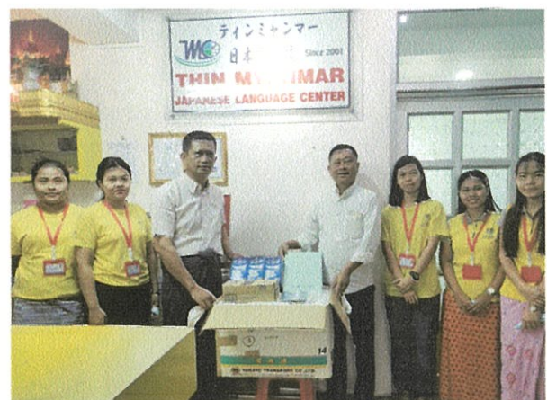
交流のある日本語学校に届いた支援物資