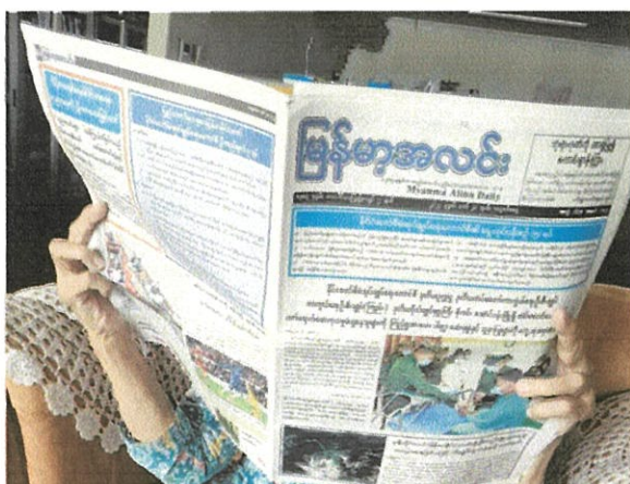
自宅でコロナの状況を心配する関係者(yangon)