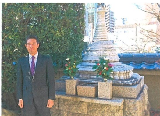
市内の東福寺さん境内にて理事長（2020.1.6）

震災時に神戸大学のミャンマー留学生（現：当会ヤンゴン事務所所長）が学んだ、命の大切さ、人との絆を大切にしていきたいものです。