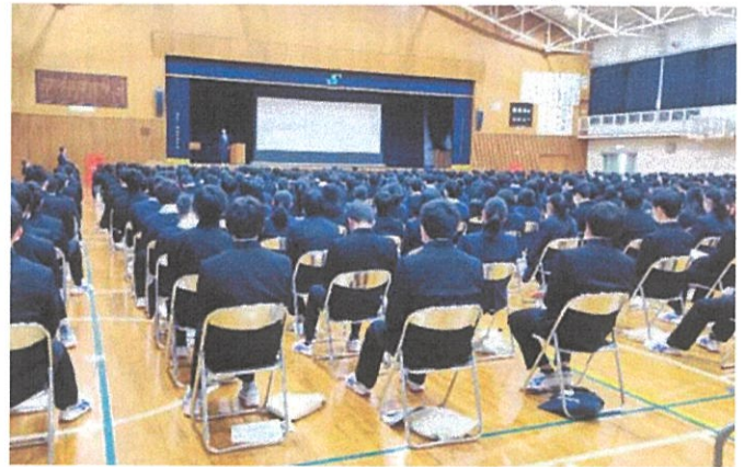
「国際理解の実践」を題目に話す理事長